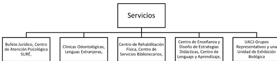
Servicios en la UACJ