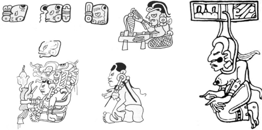
Ilustración 2. Diferentes representaciones de la deidad lunar maya Ix Sak Uh. Representaciones de códices a) Dresde , página 22b; b) Dresde , página 16c; c) Madrid , página 107; d) Dresde , página 49; e) Madrid , página 102; f) Dresde , página 16c y por último g) Dresde , página 53.

El contexto con el cual se presenta dicha imagen también nos provee información que respalda esta nueva lectura, primero porque en la tabla donde aparece la mujer, la soga está sobre un elemento conocido como la banda celeste que representa a la vía láctea o en otras ocasiones a un conjunto de estrellas durante la noche. Aunque de ella se cruza una soga que le rodea el cuello, por lo que parece estar en una horca en un acto suicida, en ningún lugar de ese contexto cercano puede leerse ningún nombre relativo a Ixtab. En segunda instancia, ese segmento es parte de otro mayor conocido como las tablas de los eclipses, que comienza en la página 50 y termina en la página 58 [ilustración 3], donde se mencionan con suficiente reiteración los ciclos de la luna, aludiendo a la deidad lunar ya mencionada (Ix Sak Uh). En algunas ocasiones, como parte de épocas de bonanza y cuando se refiere a los eclipses, es justo en la página 53 donde aparece la imagen a la que los primeros mayistas asumían como Ixtab.