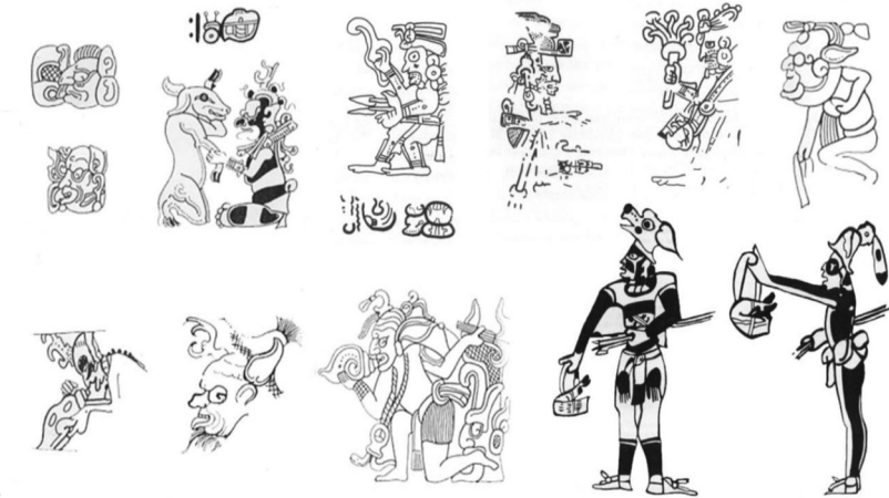
Ilustración 4. Deidad de la cacería (Venado) llamada Hu Zip o Tabay, en sus diferentes representaciones en códices, murales y pinturas. [Tomado de Ishahara 2009].

2006: 52] por la sogá que se encuentra pasando su cuello, con la que preferentemente se caza al venado (y que también la iconografía de la deidad de la caza, refiere al mismo). Tanto en su figura masculina ( Tabay ) como femenina ( XTabay ) nos remite que la obra de Landa cuando refiere al demonio de la cuerda , en realidad se refiere a la deidad de la cacería [ilustración 4].