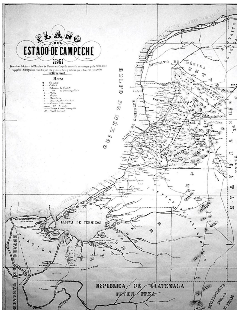
Figura 1. Plano del estado de Campeche en 1861