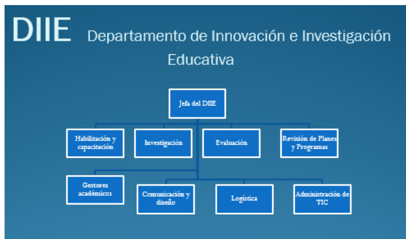
Figura 1. Organigrama del DIIE, UADY.