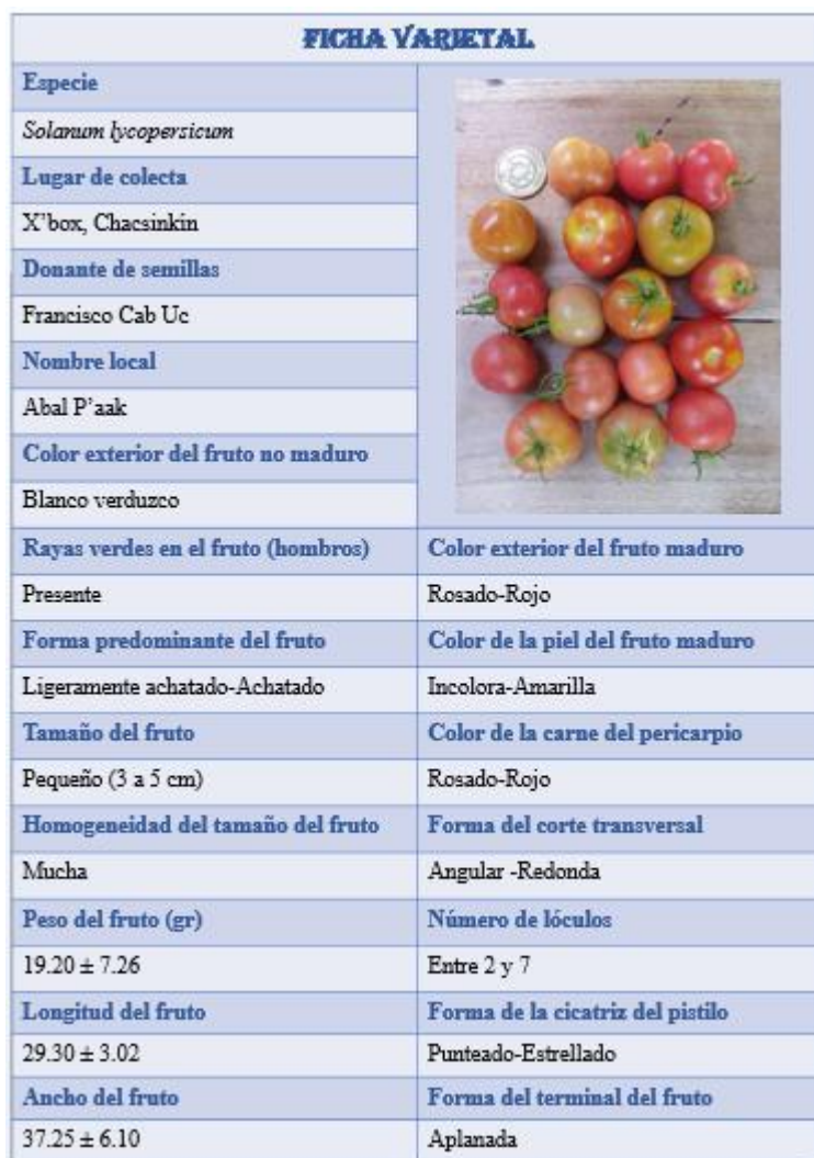
Figura 4. Foto de la ficha varietal de Abal P'aak.