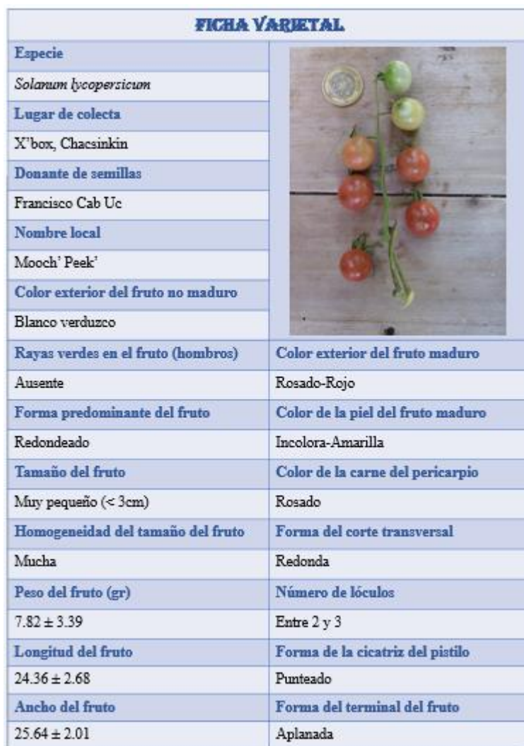
Figura 3. Foto de la ficha varietal de Mooch' Peek'.