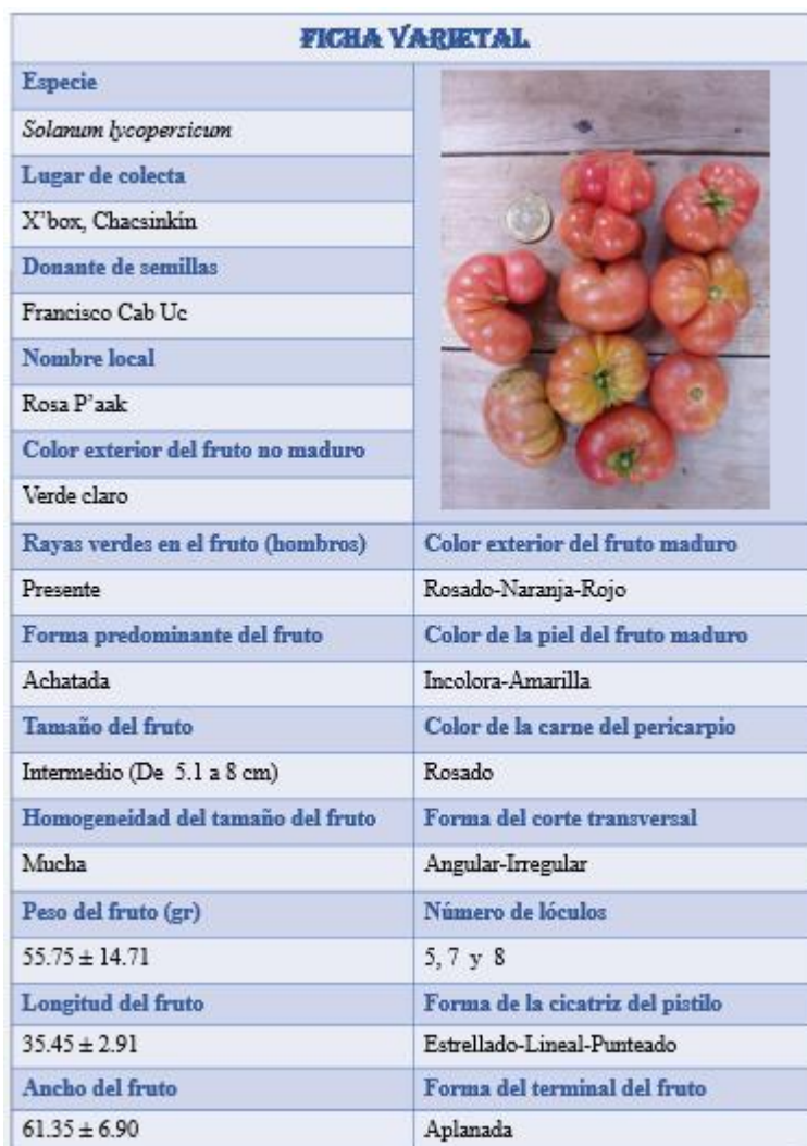
Figura 2. Foto de la ficha varietal de Rosa P'aak.