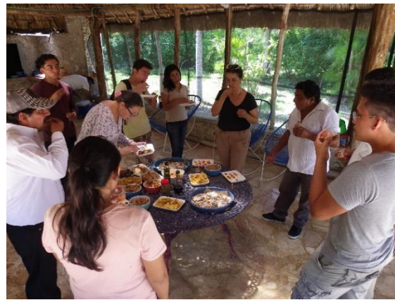
Figuras 11 y 12. Fotos de la degustación de platillos elaborados con tomates.