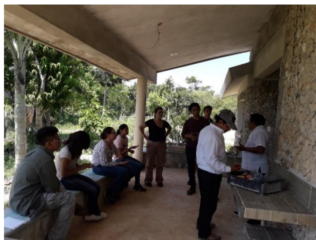
Figuras 5, 6, 7 y 8. Fotos de la exposición teórica participativa.