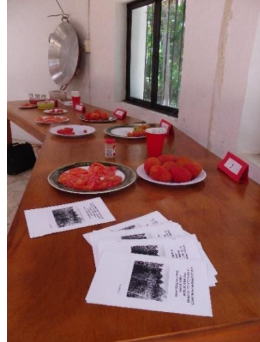
Figuras 9 y 10. Fotos de la cata de variedades de tomate.