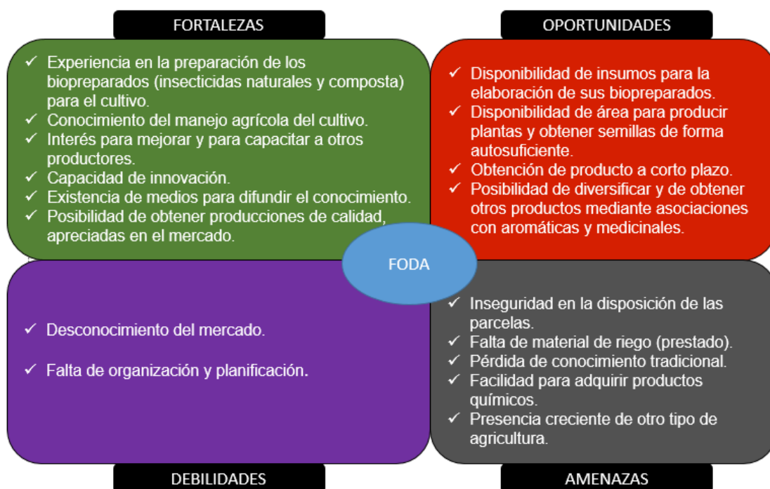
Cuadro 1: Análisis de Fortalezas, Oportunidades, Debilidades y Amenazas del cultivo de las variedades autóctonas de tomate en X'box.

prevenir las enfermedades y plagas del cultivo. Aunque el cultivo de variedades autóctonas, requiere un consumo menor de productos químicos, el productor emplea agroquímicos para la fertilización y eliminación de malezas. Esta práctica se está extendiendo entre los productores del ejido, por la facilidad que implica su aplicación, en lugar de prácticas más costosas en tiempo y mano de obra como el chapeo o uso de fertilizantes orgánicos. El uso de agroquímicos ha sido promovido por entidades gubernamentales y muchas veces se facilita su adquisición, por lo que algunos de los productores los han adoptado. A partir del análisis del manejo del cultivo por los Guardianes de Semillas se elaboró el siguiente análisis de Fortalezas, Oportunidades, Debilidades y Amenazas (Cuadro 1).