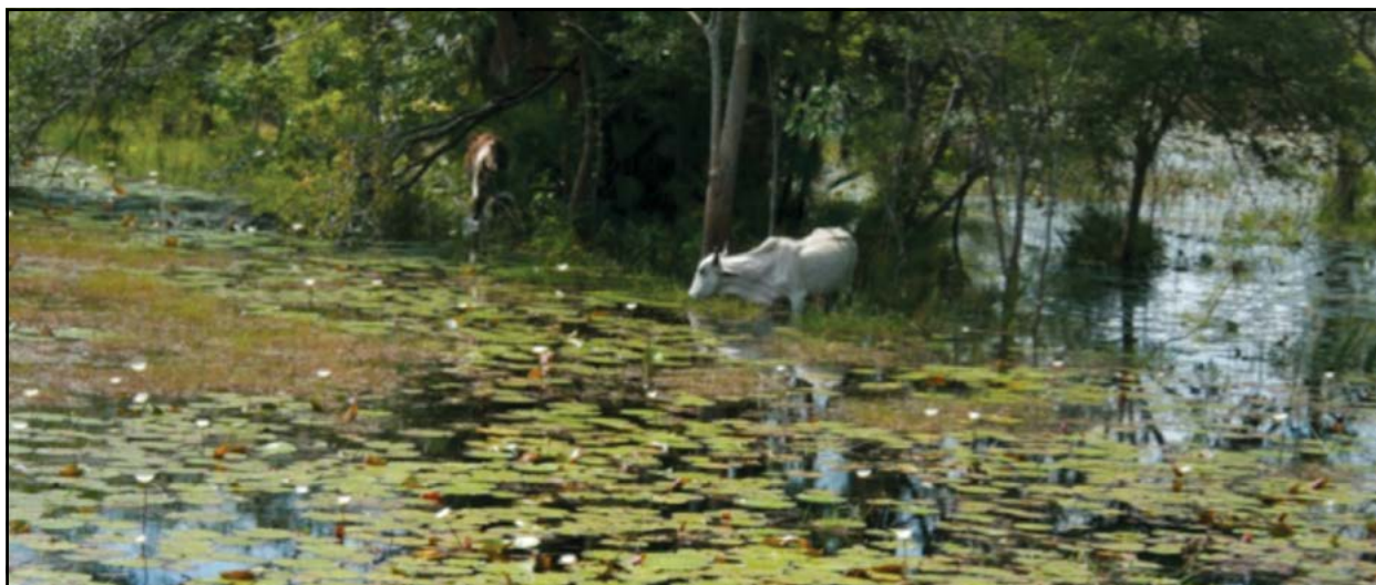
Figura 2. Vegetación hidrófila y ganado en la Reserva de la Biósfera Pantanos de Centla.

usos agropecuarios y urbanos, y para la construcción de infraestructura de transporte y de aquella relacionada con las industrias petrolera y turística. La información disponible sugiere tasas anuales de deforestación muy variables de región a región, en algunas localidades del Caribe mexicano alcanzan hasta 12% de pérdida anual (Núñez Farfán et al., 1997). La pérdida de cobertura de los manglares de México, en general, ha sido dramática con una reducción del 41% de la cobertura original (INEGI 2005a, b).