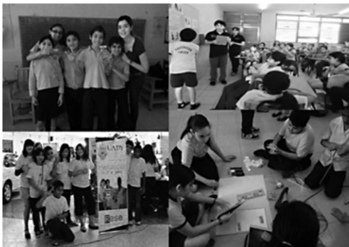
Foto 1. Niños emprendedores.

Esperamos haber dejado en estos niños la semilla de que el futuro tiene más caminos por recorrer.